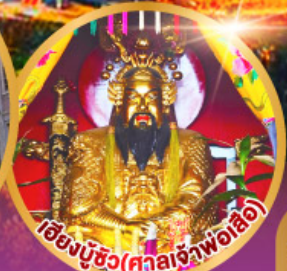
เอ็งมูซิว (ศาลเจ้าพ่อเสือ)

เมนูพิเศษ!! อาหารแต่จิว 18 อย่าง ห้ามพลาด! ไม้ต้นตำรับชิวเกา สุกี้ซิว