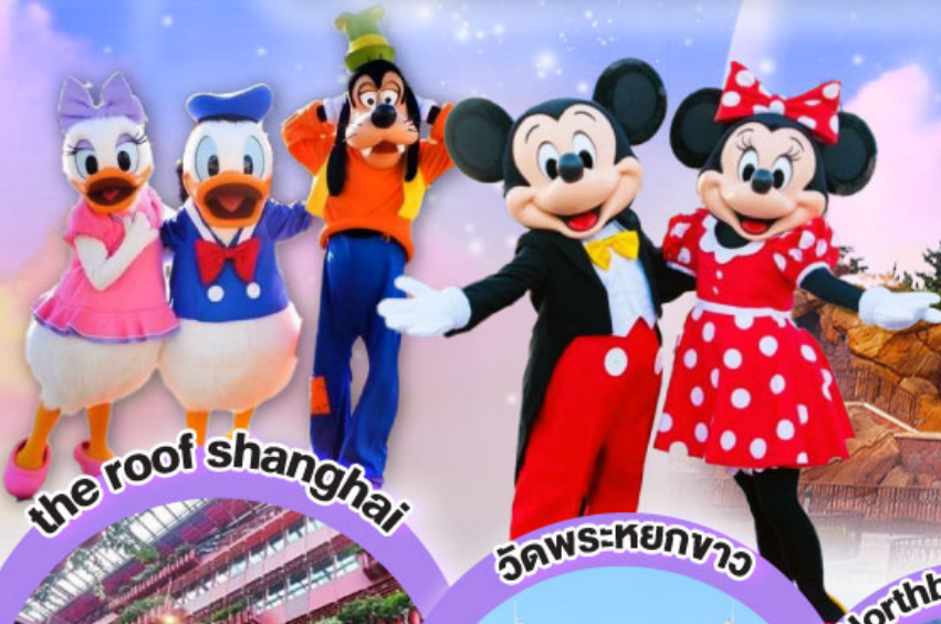
the roof shanghai