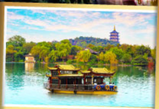
ล่องเรือทะเลสาปซีหู