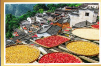
มิ่งกระเข้าขันหมอบ้านหวงหลิง