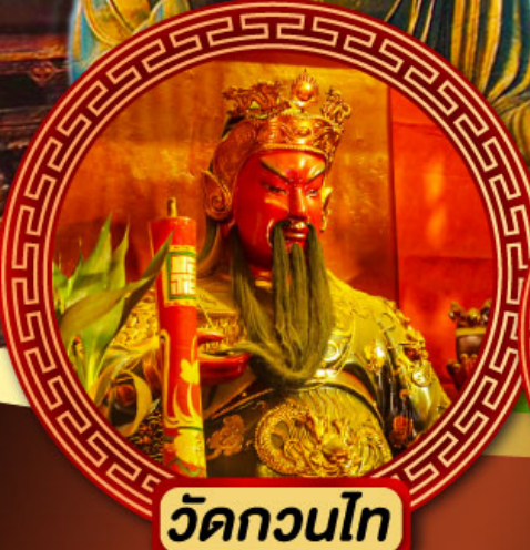
วัดกวนไท่