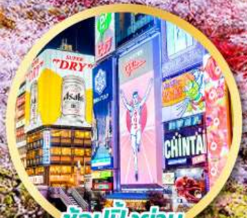
ช้อปปิ้งย่าน ชินจูกุ