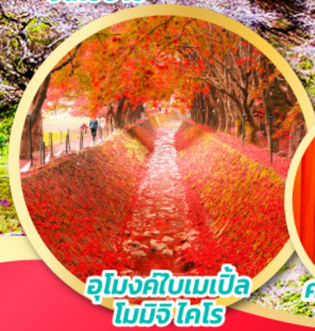
อุโมงค์ไบเมเปิ้ล โมมิจิ ไคโร