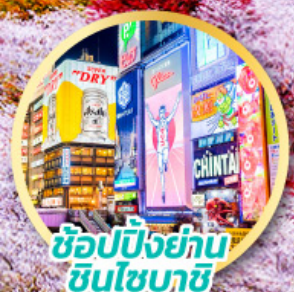
ช้อปปิ้งย่าน ชินโซบาชิ