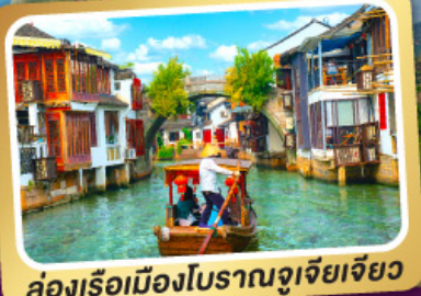
ล่องเรือเมืองโบราณซูเจียเจียว