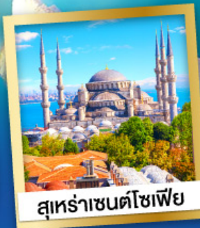
สุหรัฯาเซนต์โซเฟีย