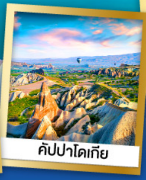
คัปปาโดเกีย