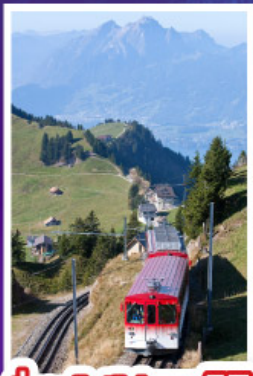
นั่งรถไฟใต้เขาริกิ