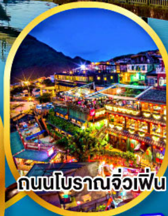
ถนนโบราณจิวเฟิน