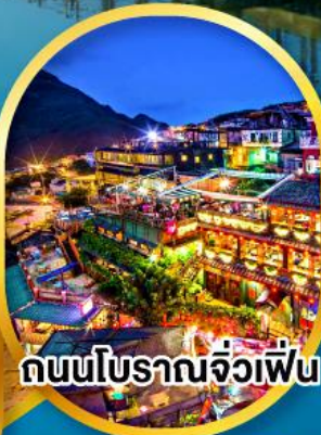
ถนนโบราณจิวเฟิน