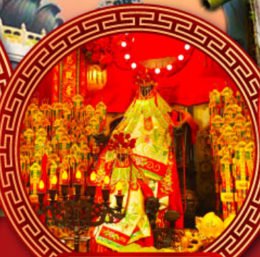
วัดเจ้าแม่กวนอิม ฮ่องกง