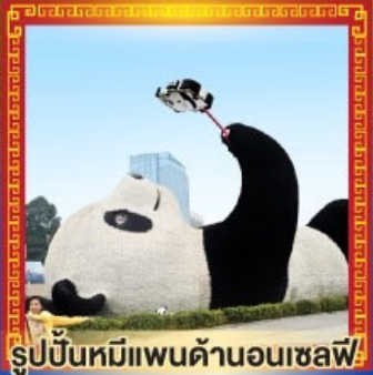
รูปปั้นหมีแพนด้าอนเซลฟี่