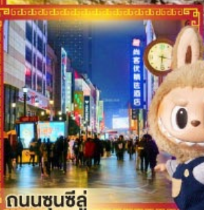
ถนนชุนชิว