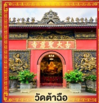
วัดต้าฉิว