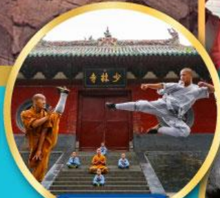
วัดเส้าหลิน ตำนานกังฟู