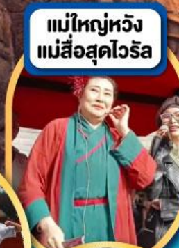
แม่ใหญ่หวัง แม่สื่อสุดไวรัล