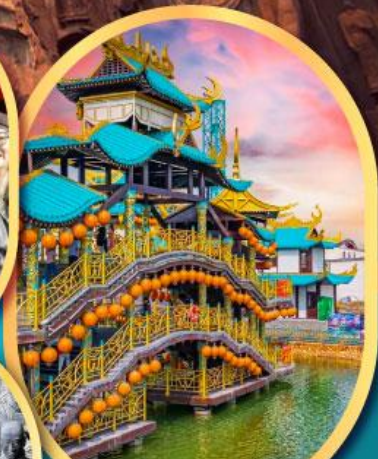
เหวว่านชู่ซาน นครจอมยุทธ