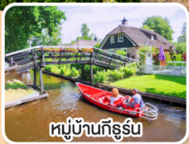
หมู่บ้านทีร์ูร์น