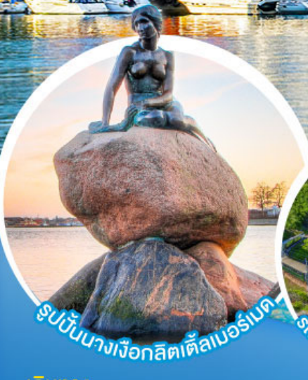
รูปปั้นนางเงือกลิตเติลเบอรัเนด