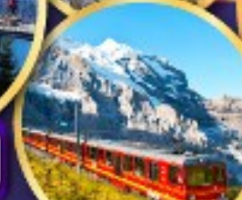
ยอดเขาจุงเฟรา