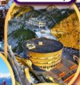
ยอดเขาฟีลาตุส