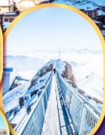
ยอดเขา กลาเซียร์ 3000