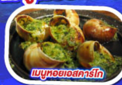
เมนูหอยแอสคาร์โท

ทานอาหาร ณภัตคารบนหอไอเฟล พร้อมชมวิวแสนโรแมนติก เมนูหอยแมลงภู่อบไวน์ขาว