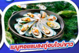
เมนูหอยแมลงภู่อบไวน์ขาว