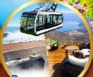
นังกระเช้าอุซุซัง

พิเศษ!! บุฟเฟ่ต์ร้าน NANDA ดีที่สุดในซัปโปโร