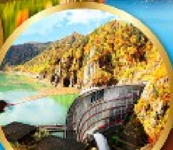
เขื่อนไฮเฮเคียว