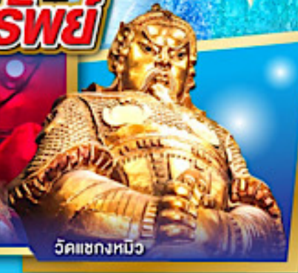
วัดเขากงหนิว

สนุกสนานไปกับสวนสนุก ดิสนีย์แลนด์แบบเต็มวัน