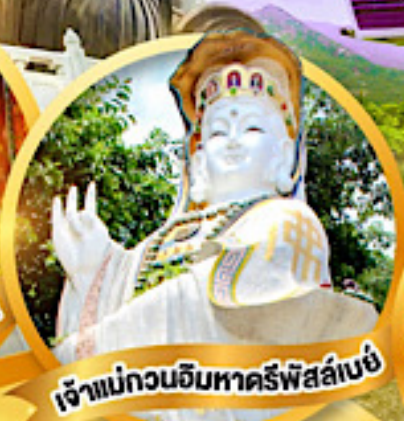
เจ้าแม่กวนอิมหาครีพีส์ลีย์