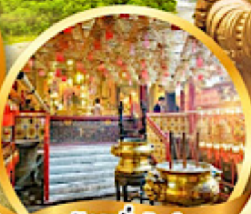
วัดหมื่นใหม่