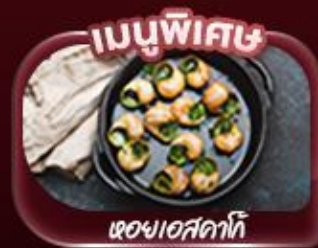
เมนูพิเศษ