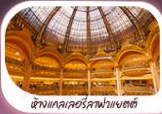
ห้างแกลเลอรีสภาพาแซตต์