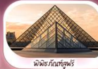
พิพิธภัณฑ์ลูฟร์