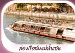
คลองเรือชมแม่น้ำแซน