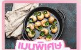
เมนูพิเศษ หอยออสตาโก้