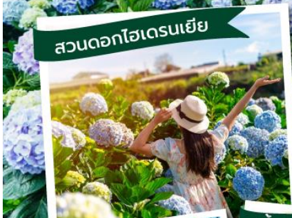
สวนดอกไฮเดรนเยีย