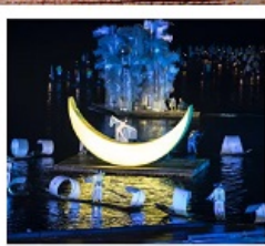
โซ่วหลิวซานเจีย