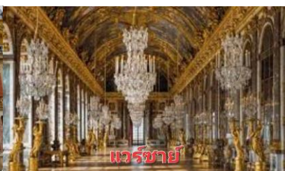
แวร์ซายน์