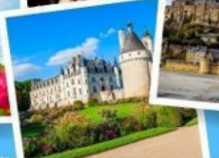
ปราสาทเชองโซ