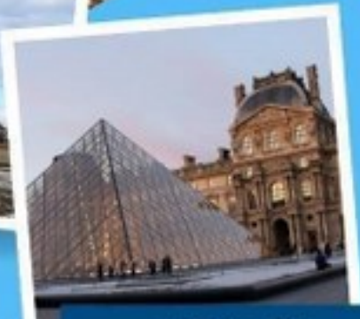
ลูฟว์ ปารีส