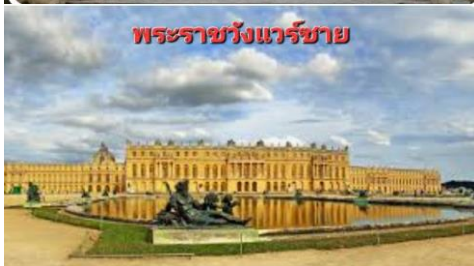
พระราชวังแวร์ซาย