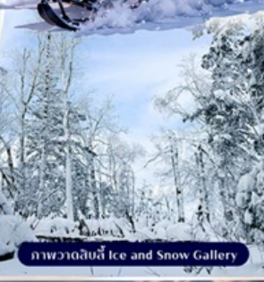
ภาพวาดด้วยน้ำแข็ง Ice and Snow Gallery