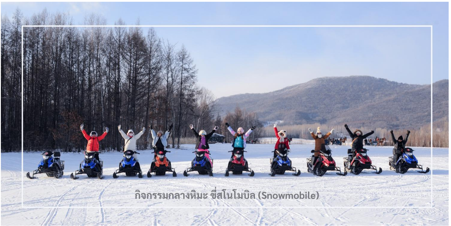
กิจกรรมกลางหิมะ ซีสนโนโมบิล (Snowmobile)

สมควรแก่เวลานำท่านเดินทางสู่เมือง มู่ตันเจียง (Mudanjiang) ใช้เวลาเดินทางประมาณ 2 ชั่วโมง มู่ตันเจียง เมืองสำคัญตั้งอยู่ใกล้พรมแดนรัสเซีย ห่างไปทางตะวันตกประมาณ 110 กิโลเมตร เมืองนี้มีเอกลักษณ์วัฒนธรรม และสถาปัตยกรรมที่ผสมผสานระหว่างรัสเซียและจีน โดยเฉพาะในฤดูหนาวเมืองจะถูกปกคลุมด้วยหิมะขาวโพลน