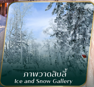
ภาพวาดหิมะ Ice and Snow Gallery

คอนเฟิร์มออกเดินทาง ตั้งแต่ 15 วัน ขึ้นไป