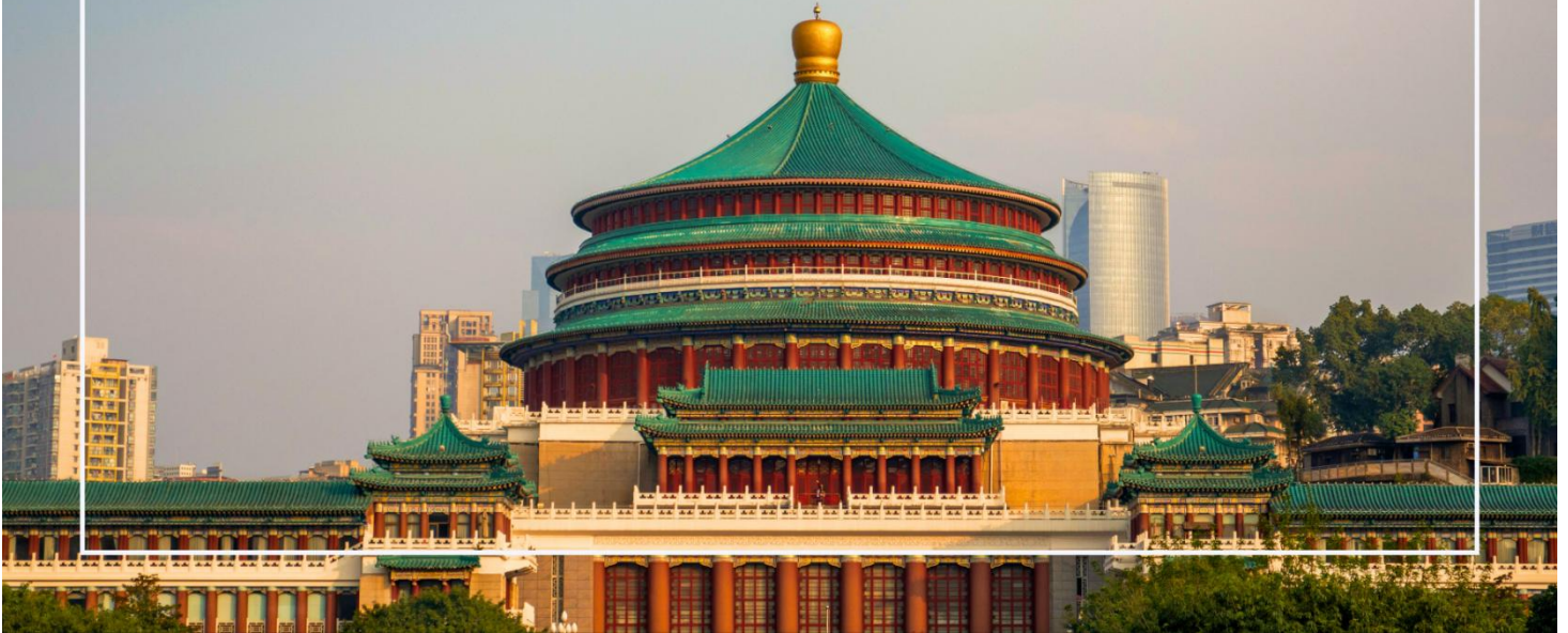
มหาศาลาประชาชนแห่งเมืองฉงชิ่ง (Chongqing People's Grand Hall)

นำท่านเที่ยวชม เมืองโบราณสี่ปาตี (Shibati Ancient Town) ตั้งอยู่ในเขตฉงชิ่ง (Chongqing) เป็นเมืองโบราณที่มีเสน่ห์และเต็มไปด้วยประวัติศาสตร์ อดีตของเมืองนี้ย้อนกลับไปหลายร้อยปี และมีการอนุรักษ์สถาปัตยกรรมแบบดั้งเดิมไว้เป็นอย่างดี เมืองนี้มีบ้านเรือนและอาคารที่สร้างขึ้นในสไตล์จีนโบราณ ซึ่งมีลักษณะเฉพาะที่สะท้อนถึงวัฒนธรรมและประเพณีท้องถิ่น และยังมี ถนนในเมืองโบราณสี่ปาตีที่มีความคดเคี้ยวและเต็มไปด้วยร้านค้า ร้านอาหาร และคาเฟ่ที่ขายสินค้าท้องถิ่น