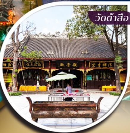
วัดต้าสื้อ