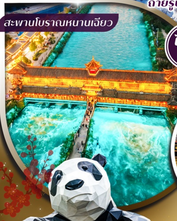
สะพานโบราณหนานเจียว

ชมความงดงาม สะพานโบราณหนานเจียว ระดับ 5A ลักการะ วัดต้าสื้อ ถ่ายรูปแลนด์มาร์คดัง แพนด้ายักษ์เซลฟี และ แพนด้าป็นตึก