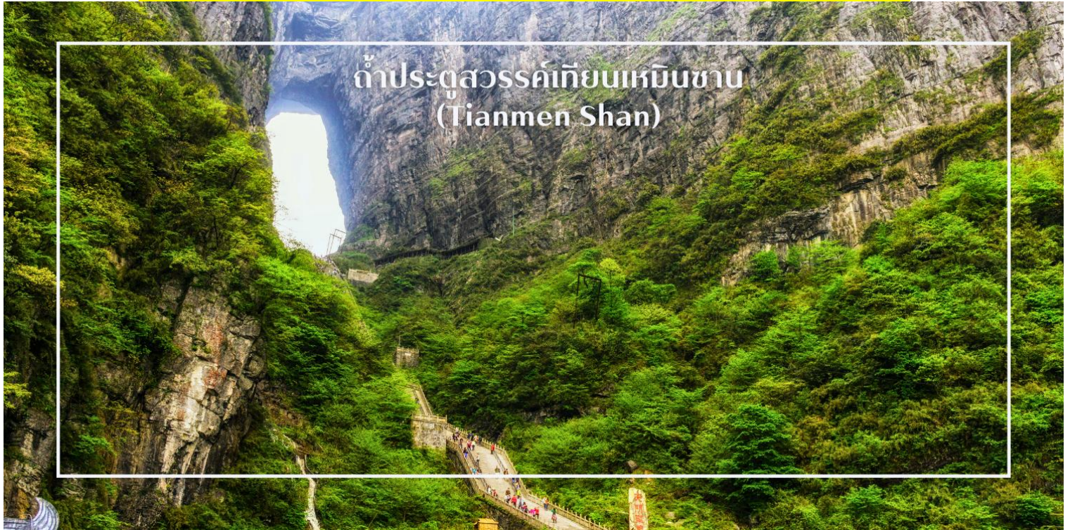
ถ้ำประตูสวรรค์เทียนเหมินซาน (Tianmen Shan)

หมายเหตุ : รายการท่องเที่ยวอาจมีการปรับเปลี่ยนตามความเหมาะสม และในกรณีเกิดภัยธรรมชาติหรือเหตุสุดวิสัยที่ทำให้กระเช้าไฟฟ้าปิดให้บริการ หัวหน้าทัวร์จะนำท่านท่องเที่ยวตามความเหมาะสมของสถานการณ์)