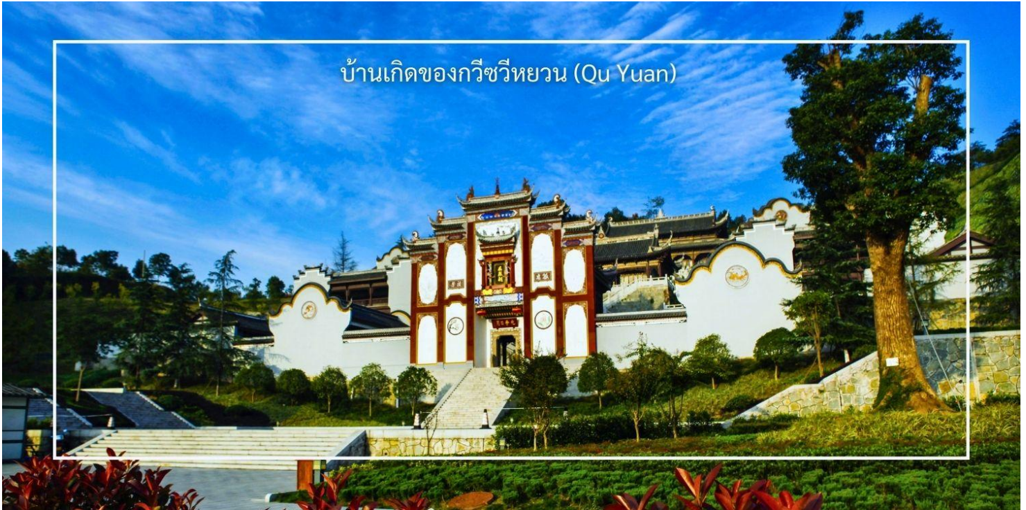
บ้านเกิดของกวีชวีหยวน (Qu Yuan)

นำท่านเดินทางสู่ มหานครฉงชิ่ง โดยรถไฟความเร็วสูง (D2377 18.13-22.31) (ใช้เวลาเดินทางประมาณ 4 ชั่วโมง) มหานครฉงชิ่ง หนึ่งในสี่เมืองที่มีสถานะเทียบเท่ากับมณฑลในประเทศจีน ตั้งอยู่ทางตะวันตกเฉียงใต้ของประเทศ เป็นเมืองที่มีความสำคัญทางเศรษฐกิจและวัฒนธรรม มีประชากรจำนวนมากและมีวิวทิวทัศน์ที่สวยงามโดยเฉพาะริมแม่น้ำแยงซี (Yangtze River) ฉงชิ่งมีชื่อเสียงในด้านอาหาร โดยเฉพาะ "ฮอตพอตฉงชิ่ง" (Chongqing Hot Pot) หรือที่คนไทยรู้จักกันในชื่อ หม่าล่าฉงชิ่ง ที่มีรสชาติเผ็ดร้อนและเป็นที่นิยมอย่างมาก นอกจากนี้ เมืองนี้ยังมีสถานที่ท่องเที่ยวที่น่าสนใจมากมาย ฉงชิ่งยังเป็นเมืองที่มีความสำคัญทางประวัติศาสตร์และวัฒนธรรม มีพิพิธภัณฑ์และอนุสรณ์สถานที่น่าสนใจให้ผู้เข้าชมได้เรียนรู้เกี่ยวกับประวัติศาสตร์ของเมืองและประเทศจีน