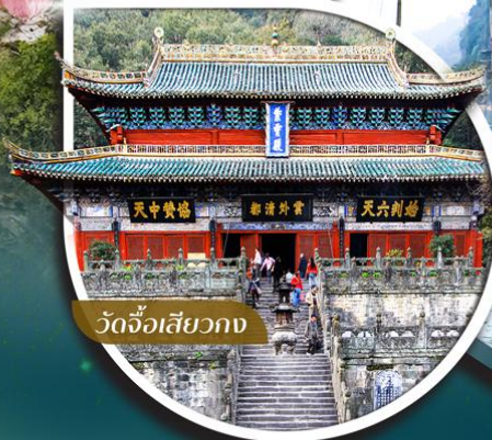
วัดจื่อเสียวกวง