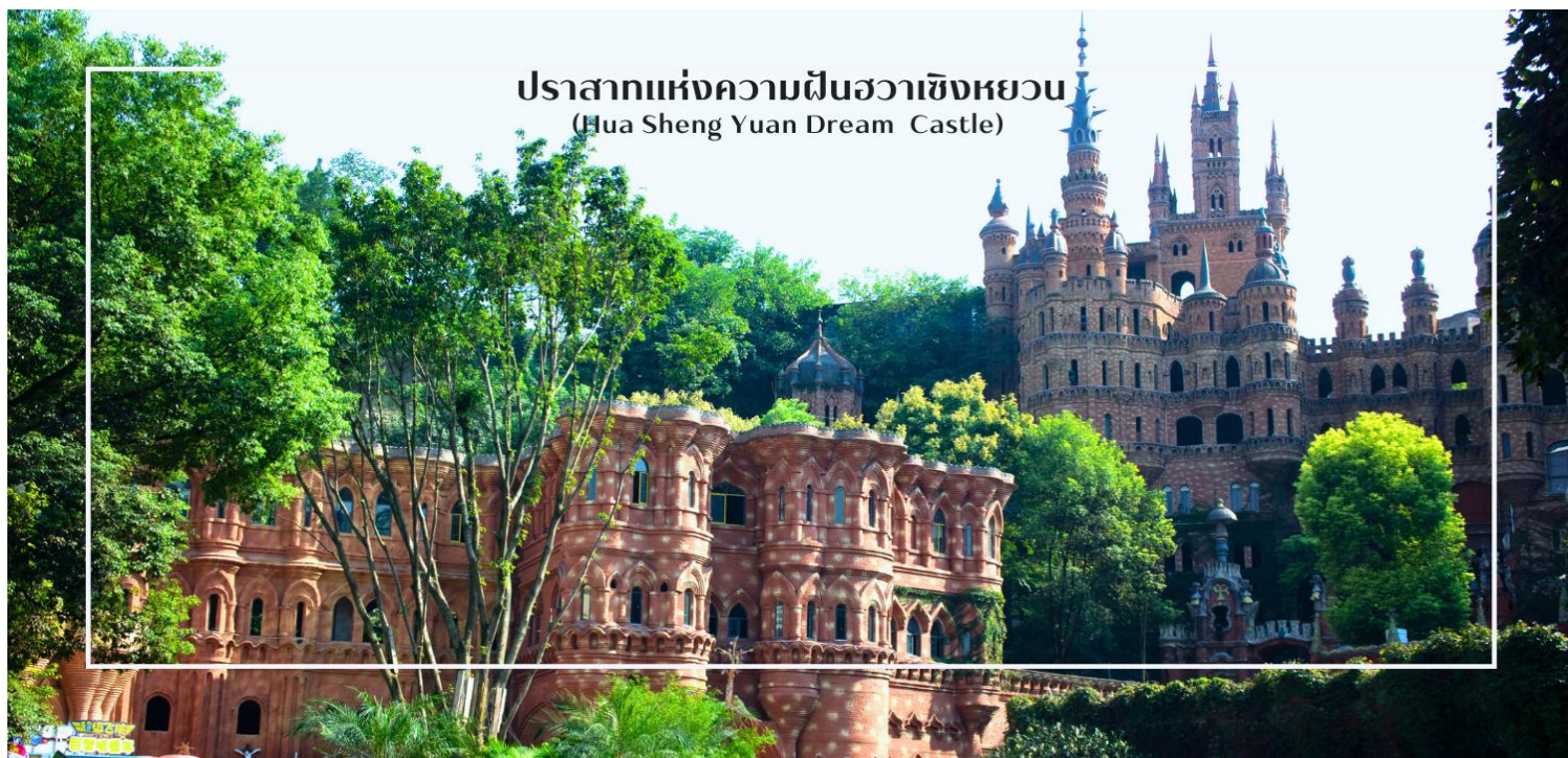
ปราสาทแห่งความฝันฮวาเซิงหยวน (Hua Sheng Yuan Dream Castle)

โรงงานผลิตขนมชื่อดังของฮวาเซิงหยวน โชนทำขนมแบบ DIY และสวนสนุกสำหรับเด็ก นอกจากนี้ในยามค่ำคืน ปราสาทจะส่องประกายด้วยแสงสีสุดอลังการ มอบประสบการณ์เหนือจินตนาการให้แก่ทุกท่าน