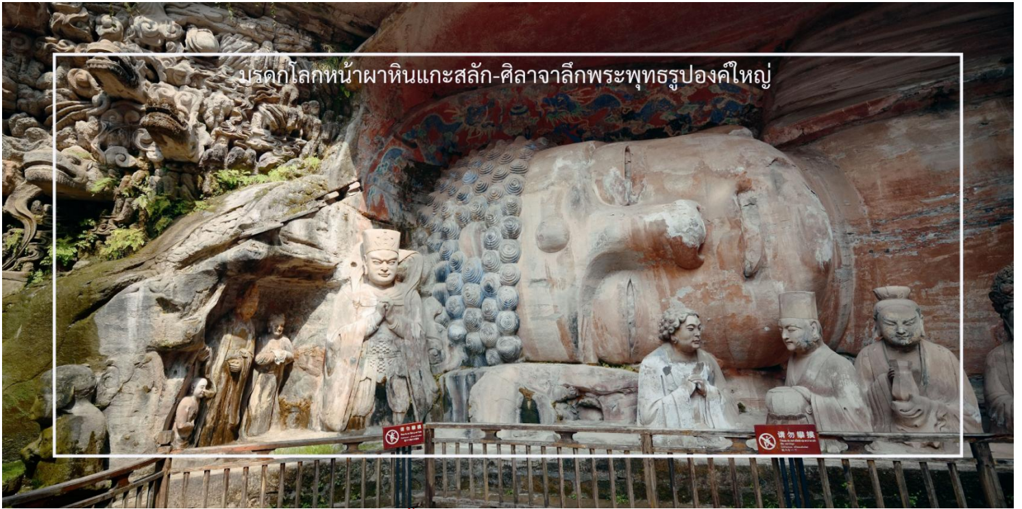
บรรดกโลกหน้าผาหินแกะสลัก-ศิลาจากลิกพระพุทธรูปองค์ใหญ่