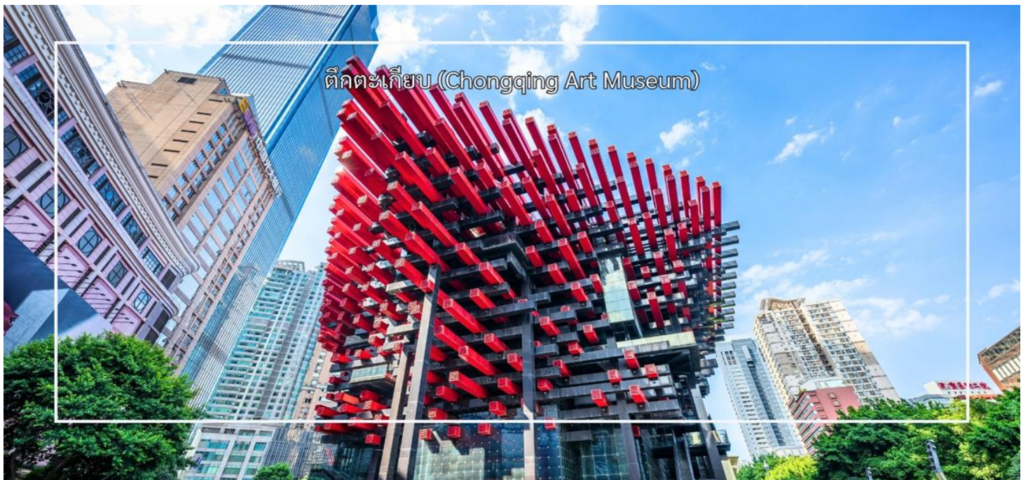
ตึกตะเกียบ (Chongqing Art Museum)

สมควรแก่เวลานำท่านเดินทางกลับผิงฉิ่ง บริการอาหารเที่ยง ณ ภัตตาคาร (มือที่ 7)