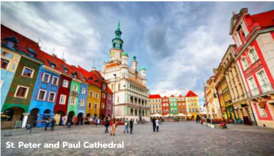
St. Peter and Paul Cathedral