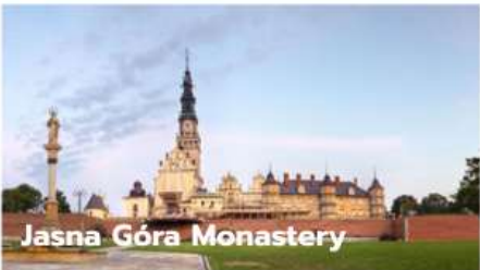
Jasna Góra Monastery