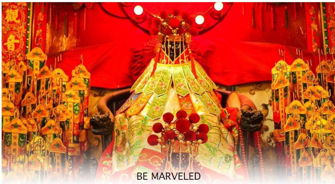
วัดเจ้าแม่กวนอิมฮวงอ่า (ยิมวิน)

หรือ วันเปิดทรัพย์ เป็นความเชื่อของคนเชื้อสายจีน ทั้งฝั่งฮ่องกง และมาเก๊าถือเป็นพิธีศักดิ์สิทธิ์ในการขอพรเจ้าแม่กวนอิม เชื่อกันว่าเป็นการไหว้และการทำพิธีที่ช่วยเสริมดวงให้เงินทองไหลมาเทมา การขอยืมเงินองค์กวนอิมที่ขึ้นชื่อเรื่องความเมตตา หรือทำการค้า เปิดธุรกิจค้าขายเจริญรุ่งเรือง