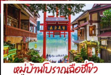
หมู่บ้านโบราณฉือซีโจว