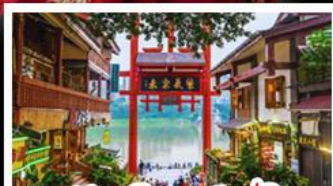
หมู่บ้านโบราณฉือซีโจว