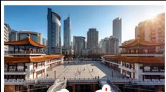
ตึกขุยซิง

พระแกะสลักหินต้าจู้ - หลุมฟ้าสะพานสวรรค์ - เจนางฟ้า ตึกขุยซิง - ตึกตะเกียบ - หมู่บ้านโบราณฉือซีโจว