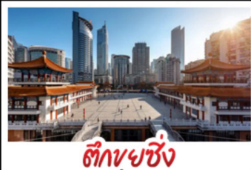
ตึกขุยซิง

พระแกะสลักหินต้าจู้ - หลุมฟ้าสะพานสวรรค์ - เวนางฟ้า ตึกขุยซิง - ตึกตะเกียบ - หมู่บ้านโบราณฉือซีโจว