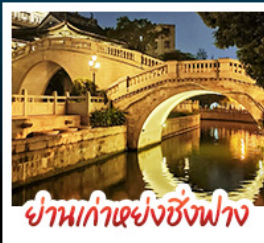
ย่านเก่าแห่งชิงฟาง