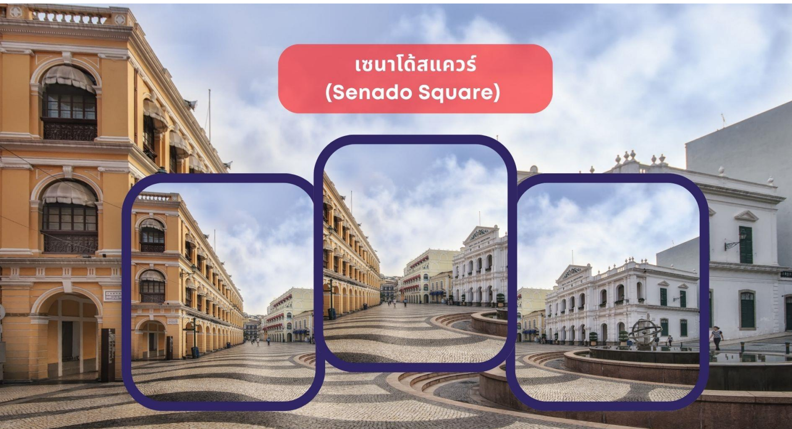
เซนาโดสแควร์ (Senado Square)

นำท่านชม วิหารเซนต์ปอล (Ruins of St. Paul's) โบสถ์แห่งนี้เคยเป็นส่วนหนึ่งของวิทยาลัยเซนต์ปอล ซึ่งก่อตั้งในปี ค.ศ. 1594 และปิดไปในปี ค.ศ. 1762 และเป็นมหาวิทยาลัยตามแบบตะวันตกแห่งแรกของเอเชียตะวันออกเฉียงใต้ โบสถ์เซนต์ปอลสร้างขึ้นในปี ค.ศ. 1580 แต่ถูกทำลายถึงสองครั้ง ในปี ค.ศ.1595 และ ค.ศ.1601 ตามลำดับ จนกระทั่งเกิดเพลิงไหม้ในปี ค.ศ. 1835 ทั้งวิทยาลัย และโบสถ์ถูกทำลายจนเหลือแต่ด้านหน้าของตึกฐานโบสถ์ส่วนใหญ่และบันไดด้านหน้าของตึกแสดงให้เห็นถึงสไตล์ผสมระหว่างตะวันออกและตะวันตกและมีอยู่ที่นี่เพียงแห่งเดียวเท่านั้นในโลก