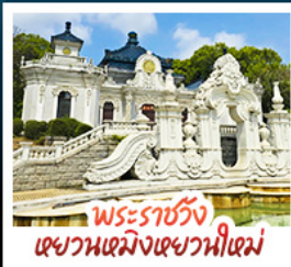
พระราชวัง เฉียนเหมิงเฉียนเหมิง