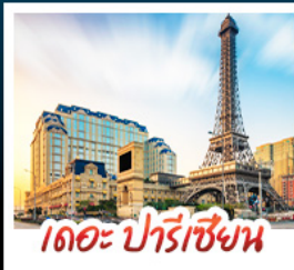
เดอะ ปารีสเซียน

สัมผัสบรรยากาศ เดอะ เวเนเซียน มาเก๊า เสมือนได้เยือนลาสเวกัส ชมความวิจิตรตระการตาของพระราชวังหยวนหมิงหยวนใหม่แห่งจูไห่ เช็กอินกับแลนด์มาร์กสุดฮิตจตุรัสสวาเอ็งถ่ายรูปแบบทิวทัศน์ของกวางเจา เที่ยวชมหมู่บ้านสไตล์ยุโรปแห่งใหม่ของเซินเจิ้น • ช้อปปิ้งเพลิน ๆ ที่ ห้างสรรพสินค้า COCO PARK ถนนคนเดินฟู้หว้อหลี่และถนนคนเดินปิกกิ้ง