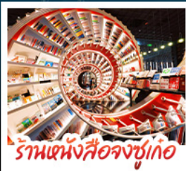
ร้านหนังสือจิงซูเกอ