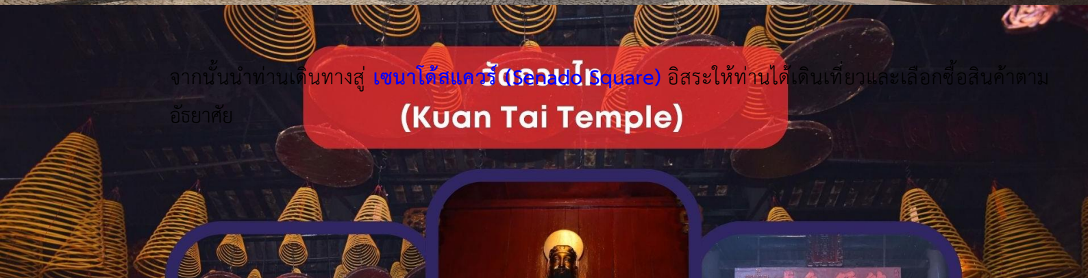
จากนั้นนำท่านเดินทางสู่ เซนาโดสแควร์ (Senado Square) อิสระให้ท่านได้เดินเที่ยวและเลือกซื้อสินค้าตามอัธยาศัย กวนไตเทมเปิล (Kuan Tai Temple)