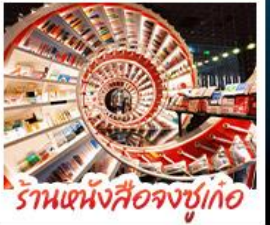
ร้านหนังสือจุงซูเกอ