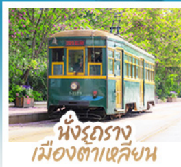
นั่งรถราง เมืองต้าเหลียน