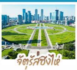
จัตุรัสซิงไฉ่