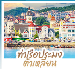
ทำเรือประมง ต้าเหลียน