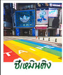
ซีเหมินดิง

สัมผัสเสน่ห์แห่งเกาะฟอร์โมซา • ล่องเรือสุริยันจันทร์ ทะเลสาบที่สวยงามแห่งหนึ่งของไต้หวัน เกาะลาลู • วัดเหวินอู๋ วัดศักดิ์สิทธิ์ริมทะเลสาบ • สักการะพระอัฐิพระกัณฐก • ชิมขนมพายไส้ปุด ของฝากยอดนิยม • อนุสรณ์สถานเจียงไคเช็ค แลนด์มาร์กทางประวัติศาสตร์ • ชิเหมินดิง ยำช้อปปิ้งสุดฮิต จิวเฟิ่น หมู่บ้านโบราณโคมแดง บรรยากาศสุดคลาสสิก • ลีอเฟิ่น ปล่อยโคมลอย • ไทเป 101 ตึกระฟ้า สัญลักษณ์แห่งความทันสมัย • จงชาน ย่านคาเฟ่และไลฟ์สไตล์สุดฮิป • วัดหลงชาน วัดเก่าแก่ เสริมสิริมงคล