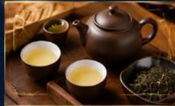
ชาอูหลงหอมกรุ่น ชาหอมเข้มข้น รสกลมกล่อม จากแหล่งปลูกคุณภาพ