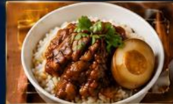
ข้าวหน้าหมูพะโล้ หมูนุ่มละมุน เคี้ยวจนหอมหวาน กลมกล่อม