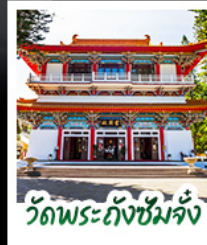
วัดพระถังซัมจั๋ง