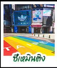
ซีเหมินตง