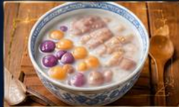
บัวลอยเผือกต้นตำรับ รสชาติหวานนุ่ม อร่อยต้นตำรับ ไม่ควรวพลาด

อิสระเดินเล่น ณ หมู่บ้านโบราณจิวเฟิน (Jiufen Old Street) พร้อมลิ้มลองอาหารพื้นเมืองชื่อดัง