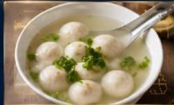
ลูกชิ้นปลา เนื้อแน่น สดใหม่ น้ำซุปรหอมอร่อย