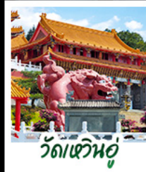
วัดเหวินอู๋