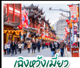
เฉิงหวงเมี้ยว