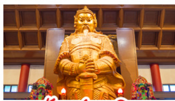
วัดเซ่งก้งหมิว