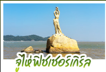
จูไห่ฟิชเชอร์รี่เกิร์ล