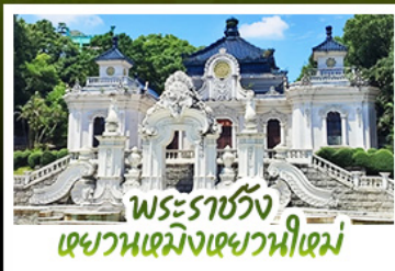
พระราชวัง เขาวงกตเมิ่งเขาวงกต