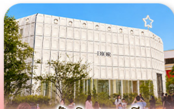
บรูกลินเกาหลี