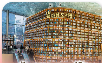
ห้องสมุดสตาร์ฟีลด์

เก็บทุกไฮไลท์ ในกรุงโซล ตั้งแต่ความงดงามของ พระราชวังเคียงบ็อก ชมวิวสุดอลังการที่ ตึกลิอิตเต้ โซลสกาย (รวมค่าลิฟต์ขึ้นตึก) สนุกสุดมันส์ที่ สวนสนุกลิอิตเต้ เวิร์ล (รวมค่าบัตรเครื่องเล่น) เพลิดเพลินไปกับโลกใต้ทะเล ลีอิตเต้ อควาเรียม (รวมค่าบัตรเข้าชม) เช็กอินแลนด์มาร์กสุดฮิตอย่างห้องสมุดสตาร์ฟิลา โคเอกมอลล์ เดินเล่นย่านฮิป บรูกลินเกาหลี ซองชูดง และช้อปปิ้งซัมเมอร์เซล สุดฟิน ย่านเมืองคงและชงแทค