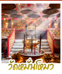
วัดหมื่นโหมว