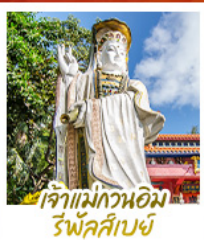
เจ้าแม่กวนอิม รีฟาส์บี้