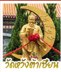
วัดเว้งต้าเซียน