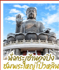
นั่งกระเช้ามองปิง ชมพระใหญ่ไผ่หลิน

นั่งกระเช้ามองปิงสักการะพระใหญ่ไผ่หลิน • วัดหวังต้าเซียน ขอพรสุขภาพ ความรัก วัดเข่งหมิว ขอพรองค์เซกุง โชคลาภ การเงินและธุรกิจ • เจ้าแม่กวนอิมรีฟาส์บี้ รับพลังงานดี เสริมพลังฮวงจุ้ย • วัดหมื่นโหมว ขอพรเรื่องการศึกษากิจการงาน สติปัญญาและความกล้าหาญ