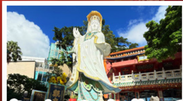
เจ้าแม่กวนอิมรัฟัสเบย์