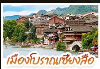
เมืองโบราณเซียงซือ