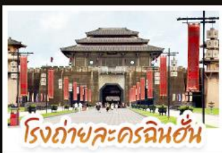
โรงถ่ายละครฉินอัน

ชมวิวนุ้บ้านม้งซีเจียงพันหลังคา • อุทยานเสี่ยวชิ่ง มนต์เสน่ห์จิวจิวโกวน้อย • อิสระช้อปปิ้งกับถนนคนเดิน สามตรอกสองซอย • สูดอากาศให้เต็มปอดบนยอดเขาชิงชิ่ง พร้อมชมความสวยงามของมวลดอกไม้ตามฤดูกาล