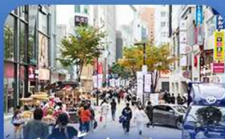
ช้อปบิงข่านเมียงดง