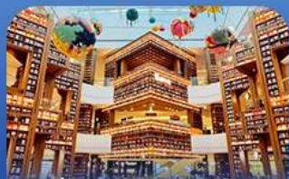
ต๋องกมุดคตารพีค