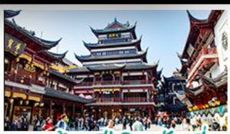
ตลาดร้อยปีฉิงหวงเหมียว