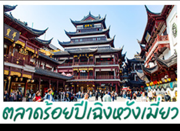
ตลาดร้อยปีเฉิงหวังเหมียว