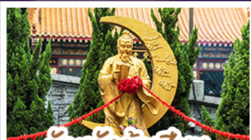
วัดเซ่งต้าเซียน