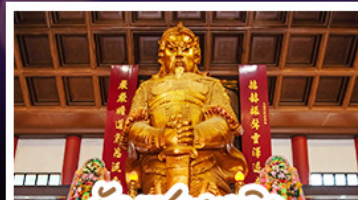
วัดเซ่งกวงเมียว